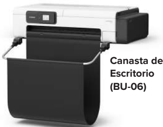
Canasta de Escritorio (BU-06)